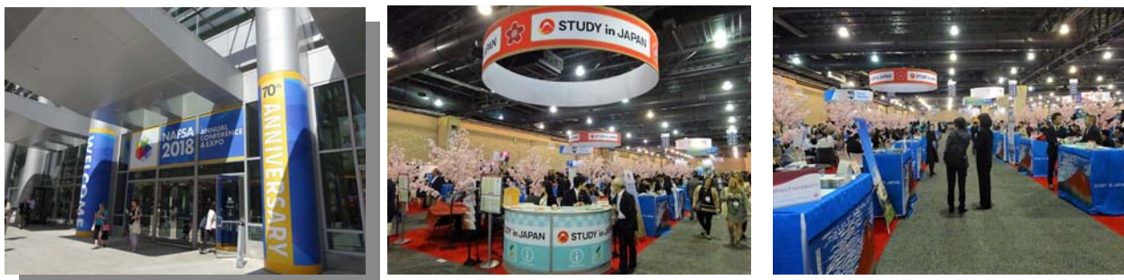
NAFSA2018 フィラデルフィア大会の会場外観および日本ブースの様子