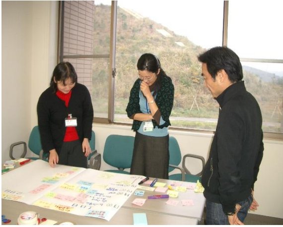
《グループワークの様子》