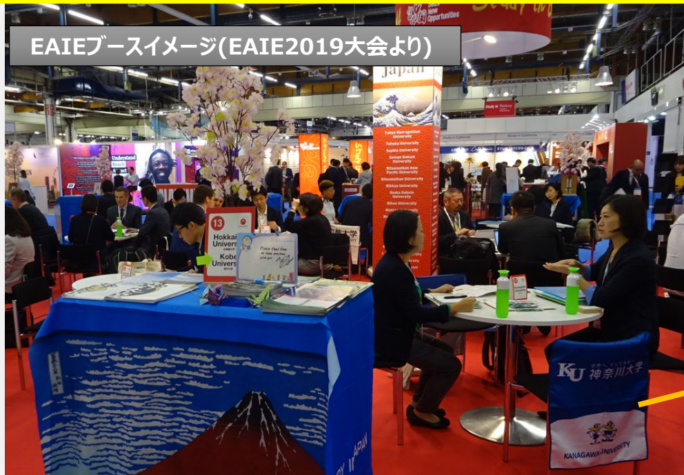
EAIEブースイメージ(EAIE2019大会より)

隣の大学さんの家具(椅子)が空いているからと借用して使うことも固くお断り致します。(各団体様の出展費で賄っているため)