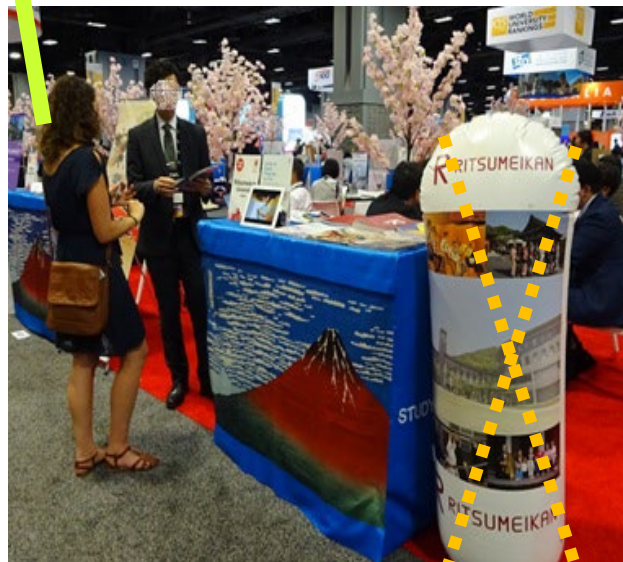
ブースイメージ(EAIE2019大会より)